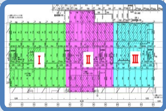
【基礎工事工区分け】